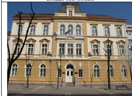
Зграда Окружног суда