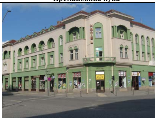
Хотел Зелени Венац