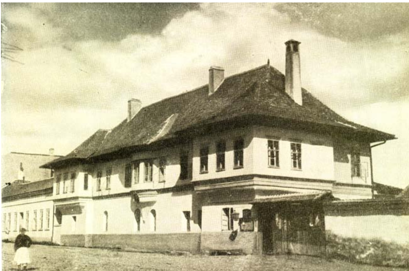
Сл. 1. Конак Господар Јеврема Обреновића у Шапцу (1822-1824), порушен 1906. године (Кojiћ, 1940)

Шабац се нарочито интензивно развијао после Другог српског устанка, када је кнез Милош Обреновић поставио за управника Шапца свог брата, Јеврема Обреновић (1790-1856). Изграђен је Јевремов конак, најпознатија и најзначајнија грађевина у то време.