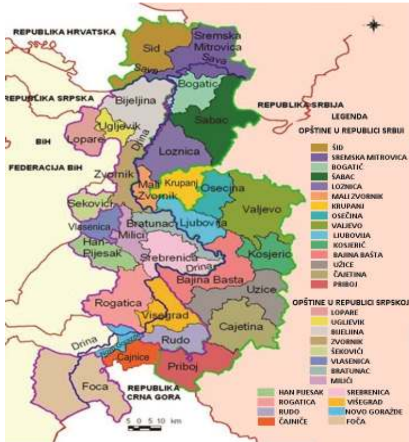
Picture 1. The Map of Podrinje 4

fourth and smallest one is the confluence of the lower basin downstream from Zvornik (91 km in length), Average altitude of the basin is 934 m.a.s.l..