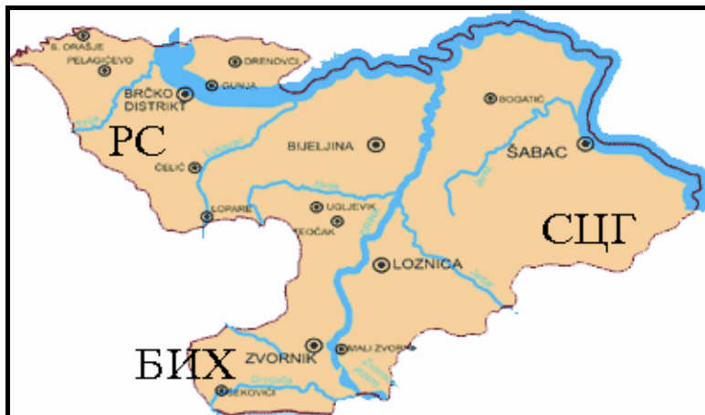
Слика 2. Мапа региона “Дрина-Сава-Мајевица”

Србији, а пољопривреда, па и туризам, поред културе и спорта, дају основ да се овакво повезивање знатно брже успостави (обнови) него у другим деловима Балкана.