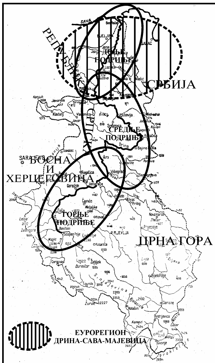
Слика 1. Слив Дрине

Позитиван пример у том смислу представља иницијатива за повезивање граничних општина западне Србије и североисточне Босне и Херцеговине преко Еурорегиона ДСМ – “Дрина-Сава-Мајевница”. Овај регион представља самосталну, нестраначку, друштвену организацију у коју се добровољно удружују општине и градови (локалне заједнице) ради институционалне оспособљености за међусобну сарадњу, размену искустава и заједничког деловања у циљу остваривања заједничких интереса. Значајна олакшица процесу интеграције претставља истоветност језика, блискост културе народа који живе на овим просторима, као и привредних веза. Тако је тузлански индустријско-рударски басен чврсто повезан са индустријом у Западној