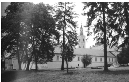
Слика 3. Манастир Круседол, један од најпосећенијих на Фрушкој гори.

У западном делу Фрушке горе се налази манастир Шишатовац . Основали су га монаси манастира Жича 1520. године, који су овде пребегли због турског насиља. Црква је посвећена Рођењу Пресвете Богородице. Од 1812. до 1827. године архимандрит овог манастира је био филозоф и песник Лукијан Мушички. Овде су боравили Вук Караџић, Павел Шафарик, Георгије Магарашевић. Иако Шишатовац има велики историјски значај, лоша саобраћајна повезаност чини га слабо посећеним (Група аутора, 2002). Манастир Шишатовац је обновљен, што доприноси повећању његове вредности.