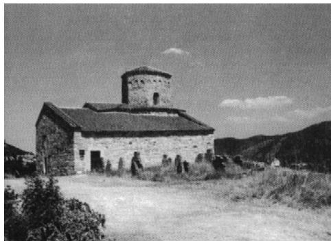
Слика 1. Црква Светих апостола Петра и Павла, најстарија у Србији.

туристичких вредности Новог Пазара и окружења, те је комплементарна њима. Туристички није довољно искоришћена.