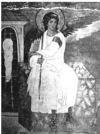
Слика 2. Фреска Бели анђео из Милешеве, светска туристичка вредност.