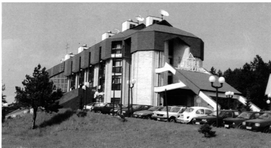
Слика 2. Хотел „Југопетрол” на Златибору.

Стабилан узлазни тренд траје од 1967. до 1975. године и код броја туриста и код броја њихових ноћења. Просечна дужина туристичког боравка је између 3 и 6 дана, што је за центре здравствено-лечилишног и спортско-рекреативног туризма релативно мало, али у границама наше стварности. Стање се објашњава смањењем броја оних који долазе ради лечења и повећањем броја оних који долазе на конгресне скупове, кратко се задржавају у транзиту или овде проводе дане викенда. Наведеним прометом туриста, Златибор је пре две деценије био најпосећенији центар планинског туризма у Србији, далеко испред Дивчибара, Копаоника и Таре.