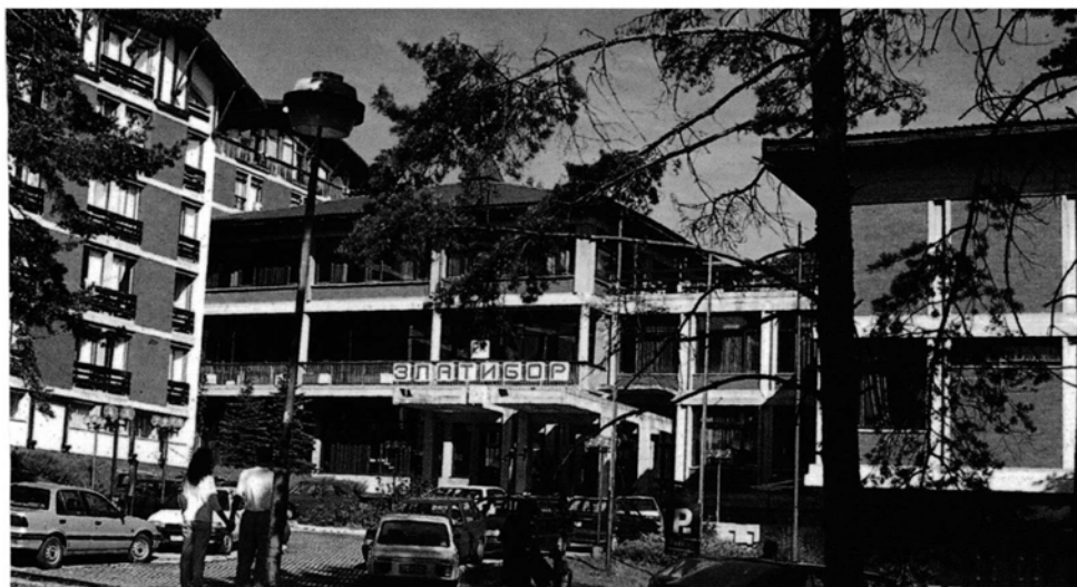
Слика 1. Комплекс рехабилитационог центра на Златибору.

а самим тим и развоја туризма, почиње шездесетих година ХХ века, када је изграђен хотел „Палисад” и почиње формирање центра за здравствени туризам.