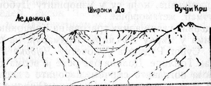
СИ. експониран цирк између Леденице и Вучјега Дола.

Ово је типски мали цирк, издубен у граниту и дно му је на висини око 1900 м. Испод њега почиње један крак Брзећке Реке, чија је долина 500—600 м. дубока, и по њеном