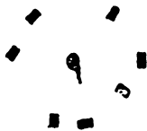
Скица 1. Села у кршу у кругу око извора.

У Сјеници, једна села у кршу поређана су око извора. У Ушаку, засеоку Доњих Лопижа, куће леже на површи око извора. Штаваљ је по странама котлинице, на чијем дну, у средини избија врело „Туркача.“ У Дунишићима неке куће су на површи око извора. И у сеоцу Долинама куће су такође поређане у кругу око извора. Села у кршу која леже кружно око извора представљена су на овој скици: