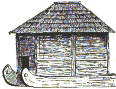
Слика 4. Колиба на стану.

Преко Сјеничког Поља води пут скоро динарског правца, спајајући Нови Пазар са Пријепољем. Све до 1912. год. овим су се путем кретале многобројне кириџије са коњским караванима. На њему су доста чести ханови, као на пр. хан „Штавалџа“, хан „У Потоке“ и т. д. Ханови имају одељење, дугачко 20—30, а широко 2—3 м, са зидовима од камена и кровом од ћерамидџа; оно је одређено за коње. Из овог одељења је као израсла двосратна зграда. На доњем спрату је соба, где је оџак за кување кафе, и под од дасака, одигнут, на коме се седи и спава; на горњем спрату су собе за путнике. Услед тога, што је кириџиски сао-