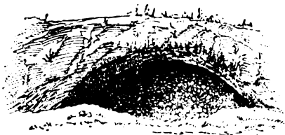
3. Лажна пећина.

и покваре. Једино би се са успехом могло борити ако би се ови крајеви пошумили. При томе треба радити с планом тј. требало би пошумљавати прво врхове точила и евентуално подизати бедеме при врховима, а не на другим местима као што је до сада рађено.