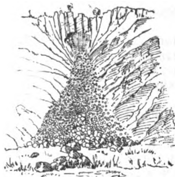
1. Изглед једног точила под Ластром

Точила су поглавито везана за стрме одсеке и стране. Њихов је облик купаст. Врх купе налази се испод одсека. (Скица 1.). Осута парчад стена тако се распоређују, да су на врху најситнија, а идући ка основици све крупнија; на основици су читави блокови стена. По ивицама точила има такође великих блокова, који су заустављени било вегета-